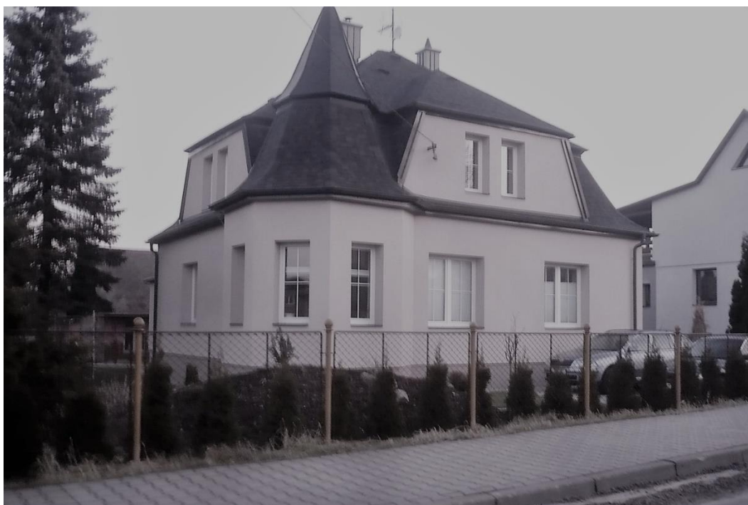
Dům čp. 400